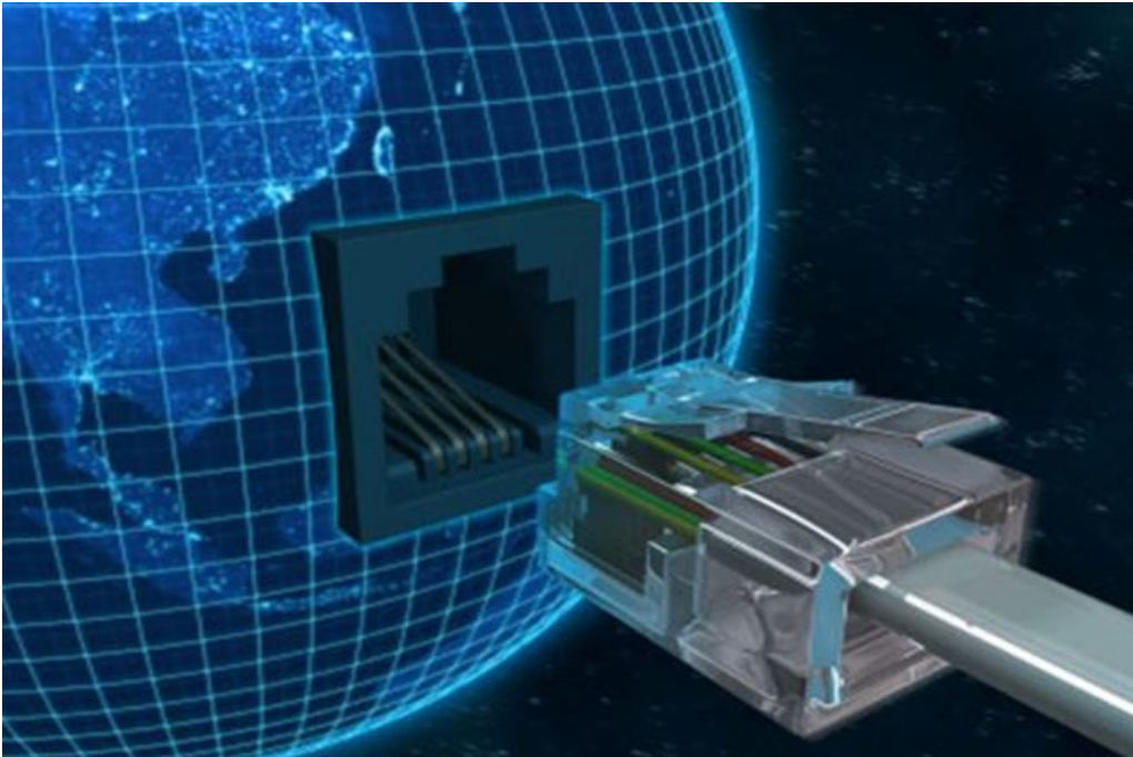
interconectividade – imagem colhida na internet

A interconectividade é a nova condição do receptor para deslocar-se, no momento de sua vontade, de um espaço de conteúdos para outro espaço. De um estoque para outro. O receptor passa a ser o único mediador na escolha de seus textos, o gerente de sua necessidade de informação. É o juiz da relevância e da prioridade; age como se estivesse colocado virtualmente e participando dentro do sistema de armazenamento e recuperação. A condição de interconectividade modifica a relação do receptor com os espaços das narrativas .