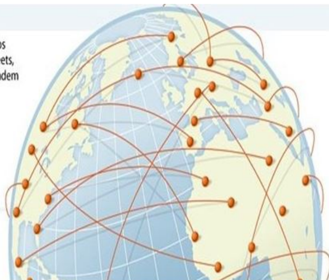
Figura recolhida na web

A quantidade global de dados digitais deve crescer de 1,8 zettabyte, hoje, para 7,9 zettabytes em 2015.