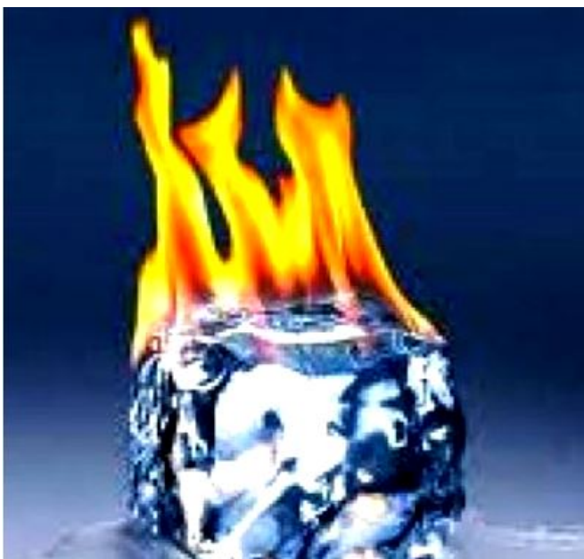
imagem recolhida na web

Uma preocupação percorre todo o texto de Calvino: o destaque colocado em duas imagens que usamos para simbolizar a estrutura da informação e a sua assimilação no espaço dos receptores. O cristal facetado e exato em sua capacidade de refratar a luz é a representação da invariância e da regularidade das escrituras modeladas no texto impresso. Uma imagem que se adapta à narrativa estruturada de centralidade e arranjo homogêneo dos conteúdos juntados em nome da ordem e do controle classificatório.