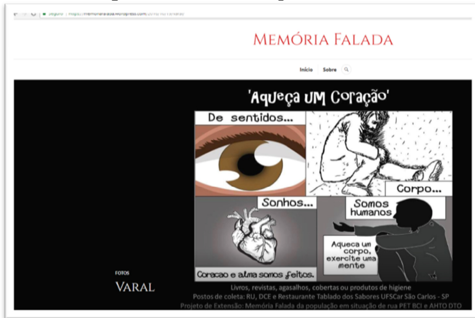
Imagem 1: Interface do Blog Memória Falada