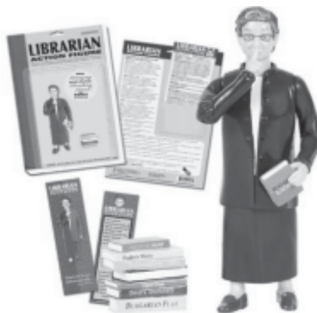
Librarian Action Figure

Kneal (2004) indica o anúncio da Figura 3 que apresenta a possibilidade de aquisição de um “boneco bibliotecário”. Mesmo considerando-se que essa boneca foi feita baseada em um profissional com essas características, sua possibilidade de mover os braços para fazer o sinal de silêncio igualmente reforça essa percepção de barreira que os usuários podem sentir em relação aos profissionais.